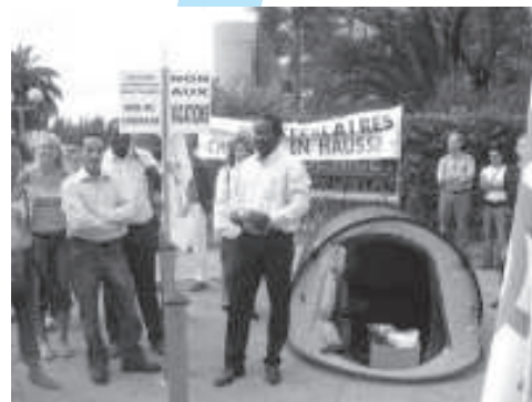
Les syndicats de la FSU dans l'action : campement de la précarité devant le rectorat de Nice

Par ailleurs, à l'heure où l'actualité économique et sociale bruit d'une crise financière qui remet en cause tous les dogmes budgétaires libéraux auxquels le gouvernement persiste à vouloir sacrifier l'éducation nationale et ses personnels, il faudra saisir l'occasion d'adresser à l'État-employeur un message sans ambiguïté. Pour exiger un service public d'éducation véritablement ambitieux pour la jeunesse, pour un véritable plan de titularisation, pour obtenir un plus grand respect pour nos missions et pour tous les personnels, le seul vote qui fait sens, c'est le vote SNES-SNEP-SNUEP-SNUIPP .