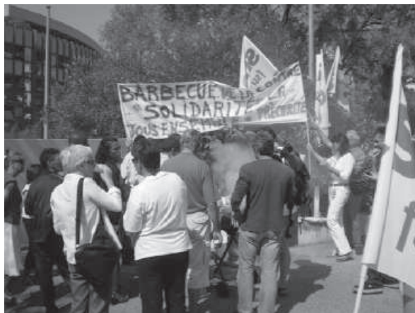
Les syndicats de la FSU dans l'action : Barbecue de la solidarité devant le rectorat de Nice

L'un et l'autre introduisent des brèches dangereuses dans le statut de la fonction publique.